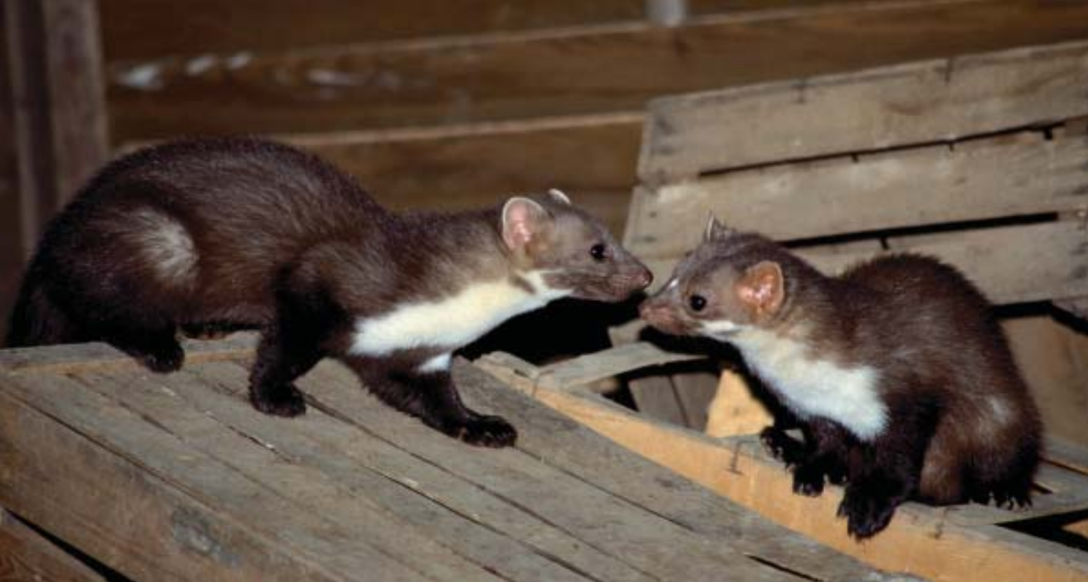
Gestommel in de nacht. Nachtelijke onrust door 'huismarters' wordt meestal veroorzaakt door jonge spelende marters.