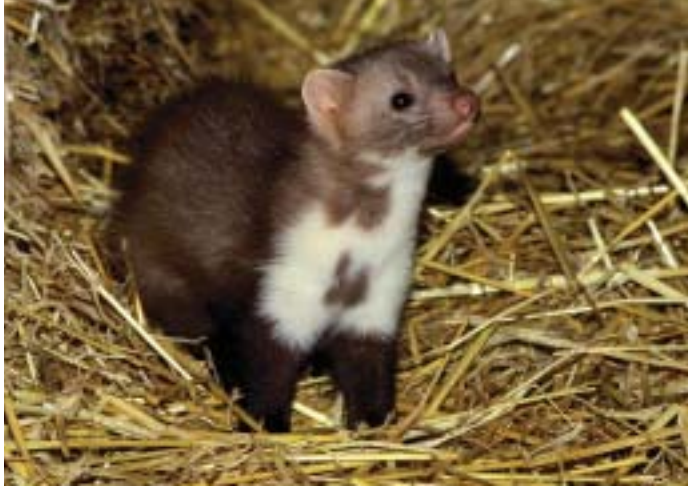
De steenmarter is waarschijnlijk al sinds de Middeleeuwen aan kleinschalige cultuurlandschappen en nederzettingen gebonden, en leefde bijvoorbeeld op boerenerven waar hij meestal als ratten- en muizenverdelger werd gewaardeerd.

onder toezicht van de provincie. Eerder waren gemeenten door het toenmalig ministerie van Landbouw, Natuurbeheer en Visserij geboden een loket voor zorgvuldige behandeling van overlast door beschermde diersoorten op te richten. Een goed onderbouwd beheerplan als blauwdruk en protocol voor de behandeling van steenmarterproblematiek was dringend nodig en zou veel onrust en onbegrip kunnen wegnemen.