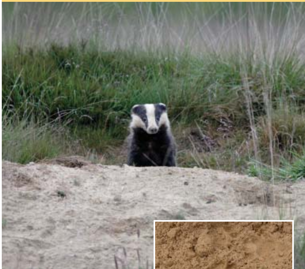
Boven: das op een burcht in open terrein. Rechts: Dassenprent.