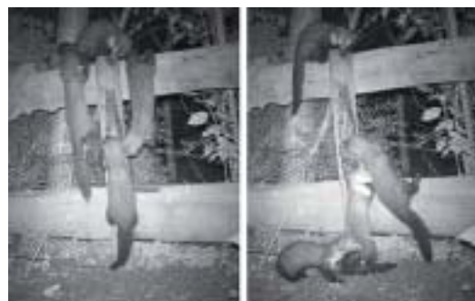
Familie steenmarters vastgelegd met een 'cameraval' in de villawijk Sahara, Wageningen (18 juni 2010, 02.30 uur).

Front naar het westen Steenmarters maken momenteel een stapsgewijze opmars naar west Nederland. In 2010 is voortplanting vastgesteld in Wageningen. Steenmarters waren hier al wel enkele jaren aanwezig en veroorzaakte spora-