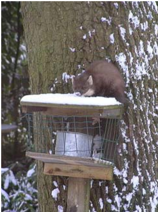
Foto 1. Boommarter op een voederplatform voor eekhoorns in een tuin aan het Papenpad in Wageningen Hoog, 30 november 2010 om 12.30 uur. Het dier at van pindakaas.

Al lange tijd worden er 'marters' waargenomen aan de oostkant van Wageningen. Zo is al een tijdje bekend dat de boommarter zich op de Wageningse Berg voortplant, specifiek op het landgoed Oranje Nassau's Oord en in de Boswachterij Oostereng. Tevens zijn er vooral vanaf het jaar 2000 zichtwaarnemingen van boommarters in het Arboretum Belmonte en het aan de wijk Hamelakkers grenzende universiteitscomplex De Dreijen. De laatste jaren zijn er ook zichtwaarnemingen uit tuinen in de bosrijke wijk Wageningen-Hoog (foto 1). Daarnaast zijn boommarters diverse malen bij Wageningen als verkeersslachtoffers gevonden, vooral op de N225 (zie figuur 1). In 2005 werd zelfs een boommarternest met twee jongen aangetroffen in het bos achter het verlaten voetbalstadion op de Wageningse Berg. Je zou hieruit kunnen concluderen dat boommarters de groene rand van Wageningen bepaald niet schuwen.