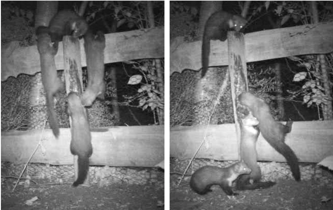
Foto 3. Familie steenmarters buitelend over het hek met daarop gesmeerde pindakaas aan de Diedenweg 19, in Wageningen (18 juni, 02.30 uur).

Bij Mevrouw Tarenskeen aan de Diedenweg 19 bleek bij inspectie door het bedrijf Trentelman, dat gecertificeerd is voor het oplossen van steenmarterproblemen, dat er inderdaad langdurig steenmarters in haar huis hadden gewoond. Er lagen veel latrines, prooiresten (o.a. ekster) en de marters konden door meerdere openingen onder het dak komen. Deze zijn dichtgemaakt en de marters zijn tot nu toe niet meer teruggekomen. Recent november 2010 zijn er wel meldingen van steenmarteractiviteit onder het pannendak van Diedenweg 31 (zes huizen verderop!). In dit huis is in 2008/2009 ook marteractiviteit geweest, met veel overlast o.a. veroorzaakt door prooiresten van konijnen .