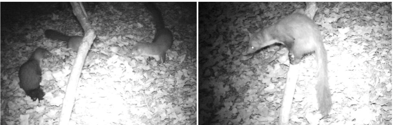
Foto 2. Familie steenmarters gefilmd in de tuin van de familie Posthumus aan de Gen. Foulkesweg-Belmontelaan in Wageningen. Links de moer ravottend met twee van haar jongen op 12 juni (03.09 uur) en dan alleen de moer op 16 juni (03.10 uur).

Op 11 juni 2010 werd allereerst om 23.02 uur, enkele uren na plaatsing van de camera, in de tuin van de familie Posthumus een steenmarter gefilmd. Hetzelfde dier, een moertje, verschijnt weer op 12 juni (01.01 uur) en at van de pindakaas tot 02.36 uur (foto 2). Om 02.53 tot 02.56 verscheen een vos, die ook van de pindakaas at (foto 4). Om 03.00 uur verschijnt het moertje weer. Om 03.09 uur zijn er drie steenmarters dartelend in beeld; twee jongen en de moer. Ze zijn duidelijk op hun qui-vive voor de vos of menselijke activiteit. Het moertje is herkenbaar door de driehoekige hap uit de punt van haar staart. Om 04.15 uur verdwijnen de marters. Op 15 juni (00.59 uur) verschijnt hetzelfde moertje weer; ook op 16 juni (01.00 uur) en ze komt een paar keer terug die nacht. Om 04.12 uur wordt ze voor het laatst die dag gefilmd. De volgende avond (16/06) is ze er weer (vanaf 21.24 uur) en op 23.39 is een van de jongen gefilmd. Op 19 juni (03.10 uur) verschijnt de vos weer. Naast steenmarters en vos zijn ook eekhoorn, egel en bosmuis gefilmd.