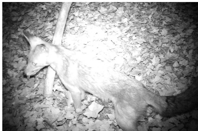
Foto 4. Ook een vos in de wijk Sahara (Gen. Foulkesweg-Belmontelaan) in Wageningen, 12/06, 02.56 uur.

Gezien de habitatkwaliteiten voor steenmarters in de wijk Sahara, is het niet verwonderlijk dat ze er gesetteld zijn. De wijk is namelijk breeduit en groen opgezet en biedt een veelheid aan voedsel in de vorm van etensresten van mensen, fruit, pluimvee, tuinvogels, en veel kleine zoogdieren waaronder muizen, eekhoorn en vooral ook veel konijnen in het nabij gelegen Arboretum Belmonte en het universiteitscomplex De Dreijen. De vele villa's met grote rustige tuinen bieden veel schuilmogelijkheid (dagrustplaatsen). Ruimten onder rieten daken blijken favoriet te zijn.